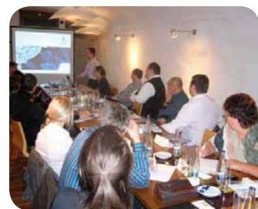
Obchodní setkání v České republice

Základním cílem této akce, která se konala v rámci vstupu společnosti SES ASTRA na místní trh, bylo posílit a rozšířit obchodní vztahy, představit účastníkům společnost SES ASTRA, seznámit je s klíčovými strategiemi společnosti