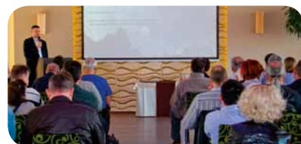
Seminář pro obchodní partnery v Maďarsku

Aktivita byla podpořena marketingovou kampaní, která zahrnovala přímou poštovní korespondenci maloobchodním prodejcům a používaly se grafické