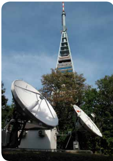
Uplinková stanice společnosti Towercom v Bratislavě

Slovenský divák oceňuje široký výběr vysoce kvalitních televizních programů za atraktivní cenu, které může ze satelitní platformy přijímat, a proto se platformě na našem trhu daří tak dobře.