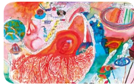
Vítězné umělecké dílo soutěže

Jejich práce byly reprodukovány a použity do kalendáře SES ASTRA na rok 2012 pro region střední a východní Evropy. Dále bylo vybráno šest výherců cen také v hlasování, kterého se účastnila veřejnost na webových stránkách www.astratalent.eu . Tyto webové stránky byly zároveň místem, které sloužilo ke komunikaci se soutěžícími a ke sběru příspěvků.