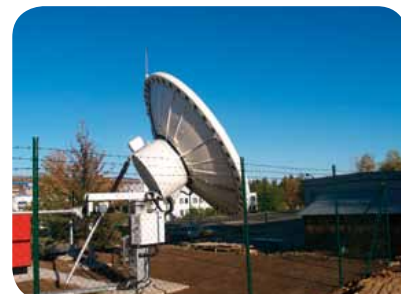
Uplinková stanice společnosti Towercom v Praze

V současné době se jako ředitel oddělení pro strategii a obchodní rozvoj zaměřuje na nové obchodní příležitosti, převážně v oblasti dodávání obsahu a datových služeb.