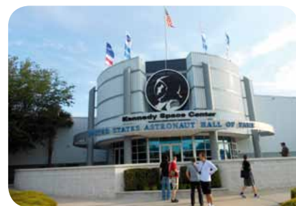
Návštěva Kennedyho vesmírného centra

Stěžejním bodem programu a jistým vzdáním holdu základnímu poslání společnosti SES ASTRA byla návštěva Kennedyho vesmírného střediska, kde všichni účastníci prošli speciálním a velmi náročným tréninkem pro astronauty, jehož součástí byla i simulace letu v raketoplánu.