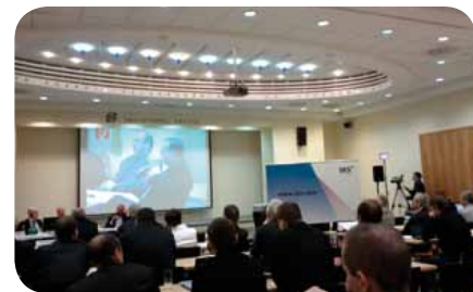
Konference CERD v Bratislavě, Slovenská republika

telům a dalším subjektům. Gala večer se konal na stadionu šampionátu EURO 2012 a společnost SES ASTRA, která byla partnerem akce, prezentovala na svém stánku program polské televize TVP HD přes satelity ASTRA. Dokázala tak, že instalaci satelitu lze provést kdekoli a kdykoli, a výsledky jsou z hlediska kvality vynikající.