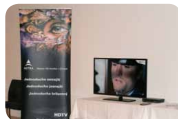
HDTV vystavená na CERD

vána na SES Broadband, získala 2. místo v kategorii Internet v rámci soutěže Cristal Antennas, která je součástí každoročního symposia světa telekomunikací a médií v polské Varšavě. Symposium je důležitým setkáním společností ze sektoru telekomunikací a médií a v celém odvětví má v tomto regionu velmi dobré jméno. Tento ročník se soustředil na výzvy, jimž telekomunikační trh čelí, důležité přesuny kapitálu v roce 2010 a 2011, digitalizaci, OTT TV a stěžejní změny v odvětví telekomunikací a médií. ←