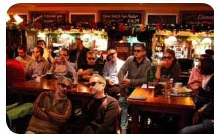
Sledování fotbalového utkání na 3DTV je jedinečný zážitek

Formát 3DTV je považován za budoucnost televizního vysílání, neboť televizním divákům nabízí jedinečnou kvalitu a zážitek. Vysílací společnosti