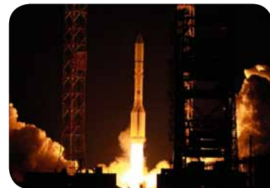
Vypuštění družice SES-4

Po tomto nedávném přírůstku provozuje nyní SES coby jednotná platforma s globálním dosahem flotilu padesáti družic, které pokrývají 99 % světové populace. Aby zajistila vysokou kvalitu služeb, do roku 2014 vypustí společnost SES do vesmíru ještě dalších sedm družic, které zvýší celkovou kapacitu oproti konci roku 2011 o 19 %.